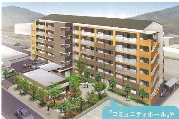
『コミュニティホール』や『緑溢れる広場』を設置。